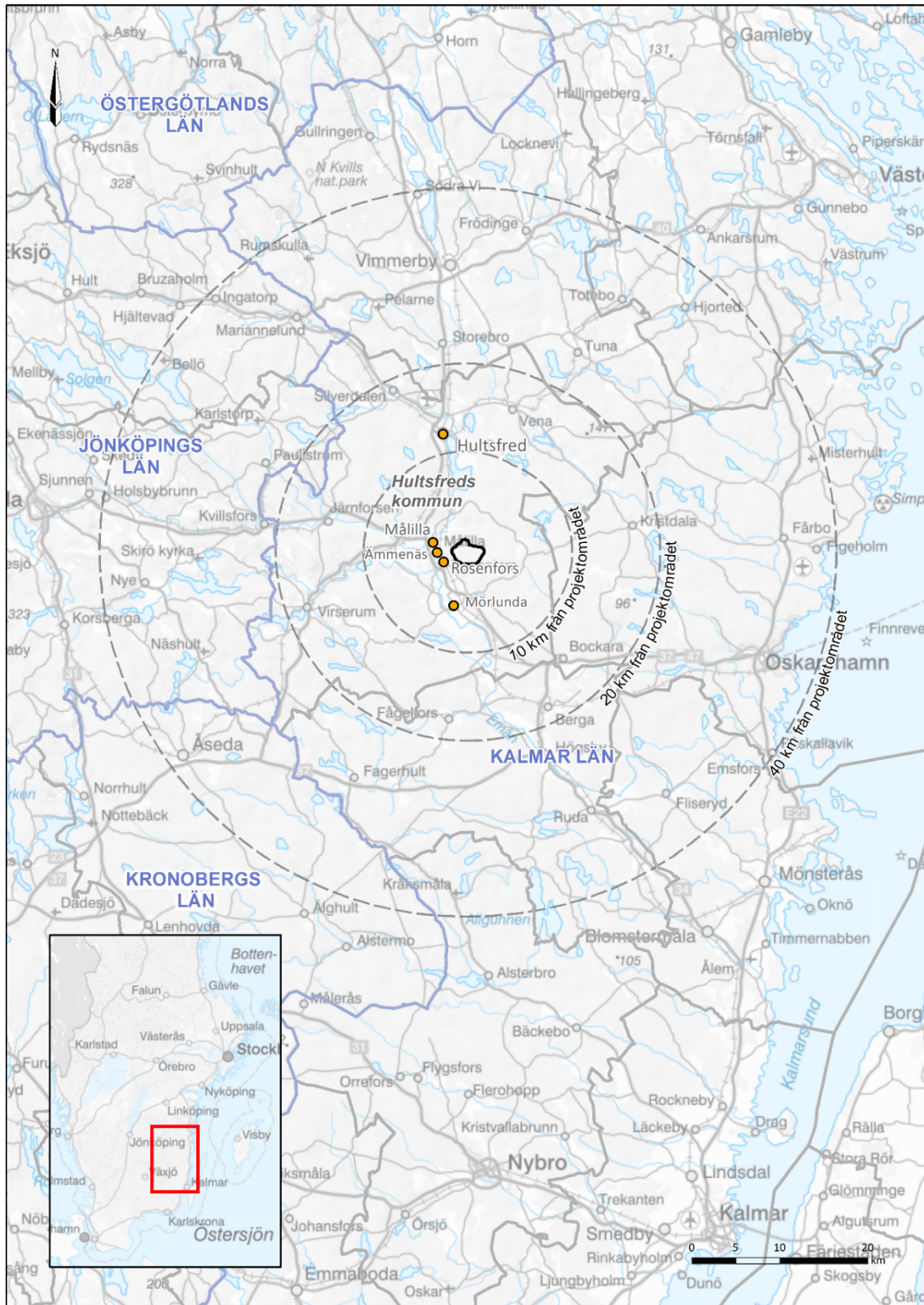
Figur 1. Översikt av projektområdets placering.